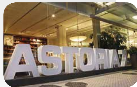
HÔTEL 4* ASTORIA 7 SAN SEBASTIAN